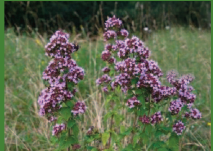
Wilder Dost ( Origanum vulgare )