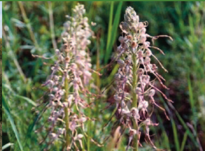
Bocksriemenzunge ( Himantoglossum hircinum )