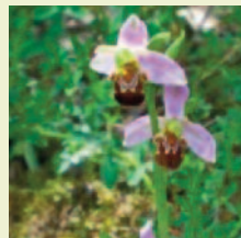
Bienenragwurz ( Ophrys apifera )