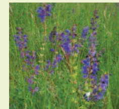
Wiesen-Salbei ( Salvia pratensis )

Die kargen Bedingungen sind Voraussetzung für das Gedeihen vieler seltener Pflanzenarten.