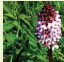
Purpurknabenkraut ( Orchis purpurae )

Im Naheland finden sich häufig auf alten Weinbergen im Bereich von südausgerichteten, steilen, trockenen Hangflächen heimische Orchideen.